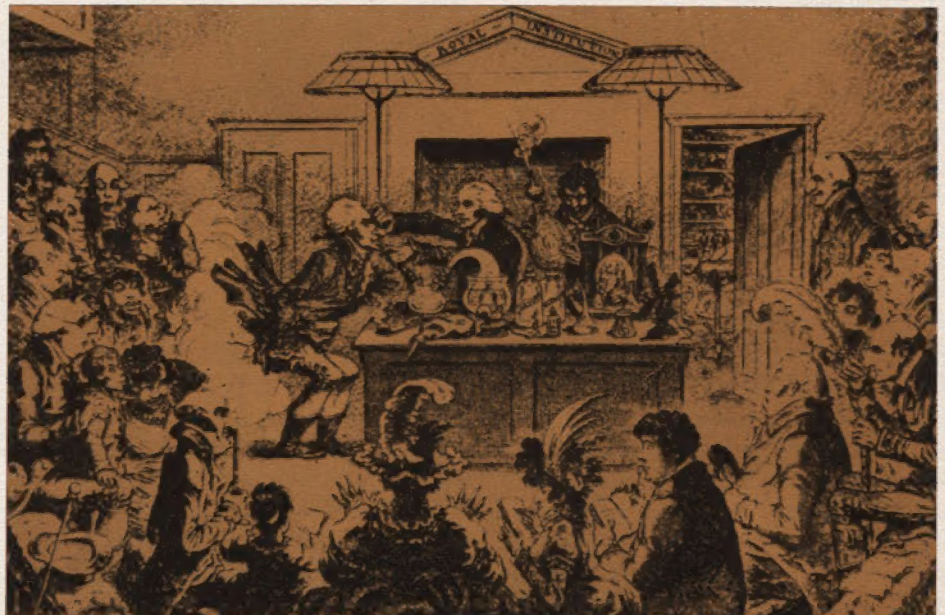
Fig. 1 Una lezione sperimentale alla Royal Institution.

se con la repulsione il moto nell'universo. L'interesse della scienza inglese del '700, ferme restando le permanenti spiegazioni teologiche (segno del compromesso delle forze laiche della borghesia con la chiesa anglicana), ma sempre più sullo « sfondo » della scienza naturale, era soprattutto per i modelli. I primi, in termini dinamico-corpuscolari, usano ancora la matematica di Newton per descrivere le azioni fisiche come azioni a distanza, sull'esempio di quelle gravitazionali, fra corpuscoli atomici caratterizzati soltanto da dimensioni, posizione e momento: conservano ancora qualcosa dell'aristocraticismo intellettuale di Newton volto all'astrazione matematica. Poi però, a metà del secolo, l'attenzione fu rivolta maggiormente al momento sperimentale, accompagnandosi a ciò una nuova fortuna dell'empirismo di Bacon 5 . In questo momento la valorizzazione della tecnica raggiunse un nuovo, più alto livello, anche a scapito dell'ortodossia newtoniana. Fu allora accettata ufficialmente dalla Royal Society nel 1759 la confutazione della teoria newtoniana della dispersione cromatica, e dunque dell'impossibilità di costruire telescopi a rifrazione troppo potenti che non deformassero la visione, da parte di un semplice occhialaio di Londra, John Dollond, che mostrò sperimentalmente la possibilità di ridurre la dispersione usando vetri con diverso indice di rifrazione. Intanto si sviluppavano modelli, anch'essi di derivazione newto-